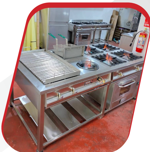
COCINA MIXTA DE 8Q