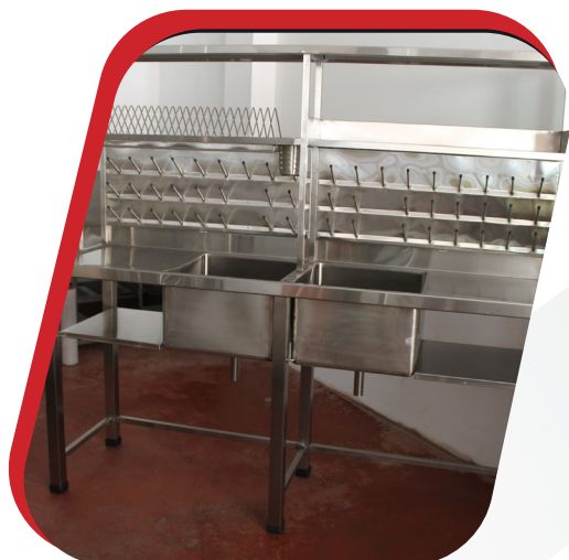
LAVADERO DE 2P CON 2 MESAS