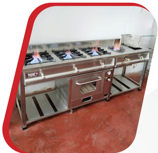
COCINA MIXTA DE 3Q CON FREIDORA