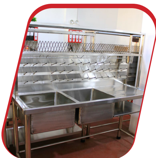
LAVADERO 2P CON ESCURRIDOR