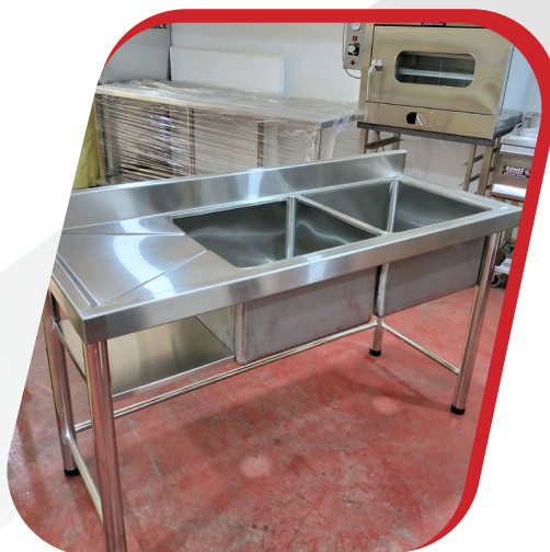
LAVADERO DE 2 POZAS