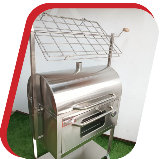
CAJA CHINA PRO 4 EN 1