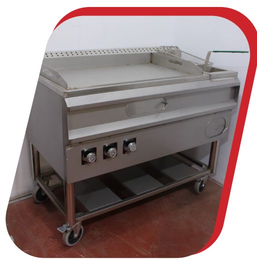
PLANCHA FREIDORA MIXTA