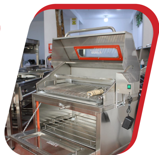
CAJA CHINA PREMIUM CON MOTOR