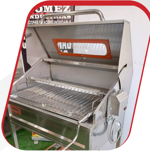
PARRILLA PREMIUM CON MOTOR