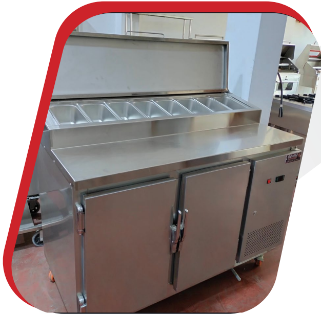
MESA REFRIGERADA DE ACERO INOXIDABLE