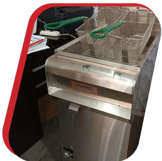
FREIDORA CONVENCIONAL CAPACIDAD 10 L