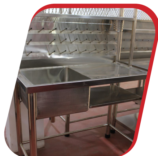
LAVADERO DE 1P