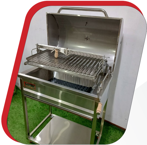
PARRILLA PRO 2 EN 1