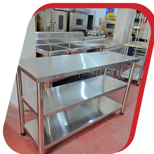
MESA DE TRABAJO CON 3 NIVELES