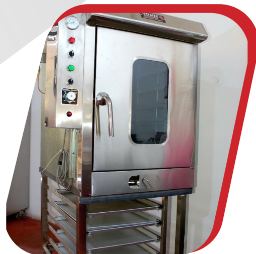
HORNO PANADERO TURBO 6B