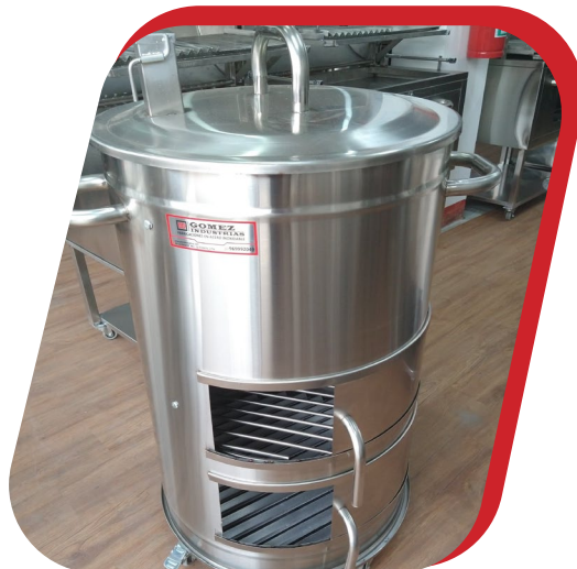
CILINDRO AHUMADOR GRANDE