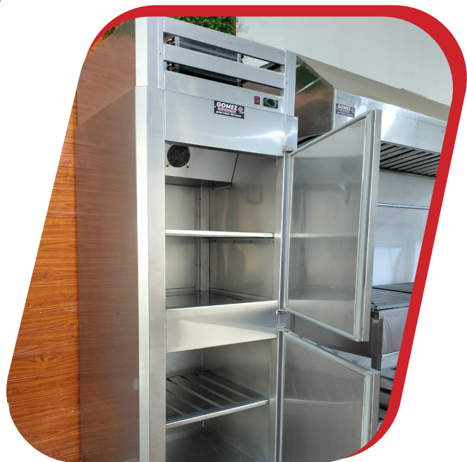
CÁMARA REFRIGERADA DE ACERO INOXIDABLE