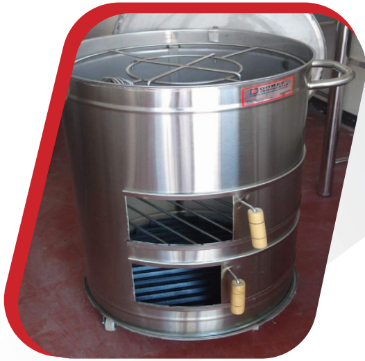
CILINDRO AHUMADOR PEQUEÑO