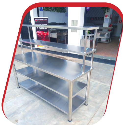
MESA DE TRABAJO CON 5 NIVELES