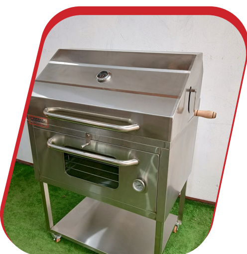
CAJA CHINA PREMIUM