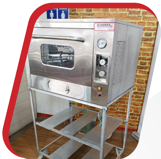
HORNO MULTIUSO 3 NIVELES