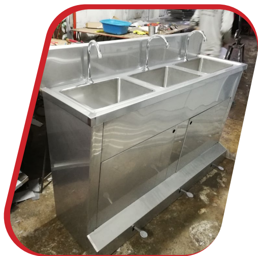
LAVADERO SANITARIO 3 POZAS