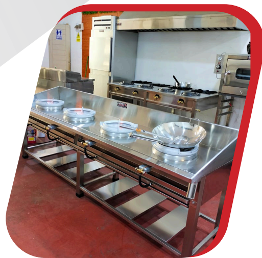
COCINA CHIFERA DE 4Q