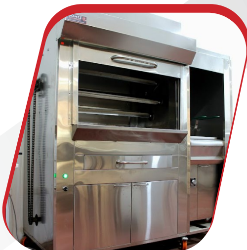
HORNO POLLO A LA BRASA