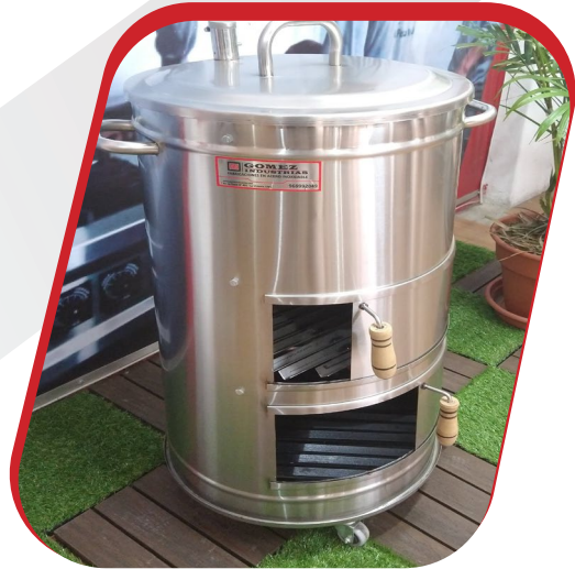
CILINDRO AHUMADOR MEDIANO