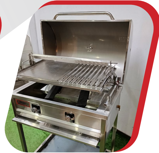
PARRILLA HIBRIDA ( uso a carbón o gas)