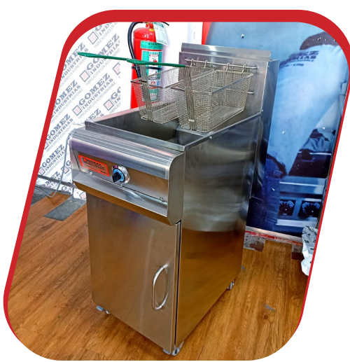
FREIDORA DE PAPAS AUTOMÁTICA